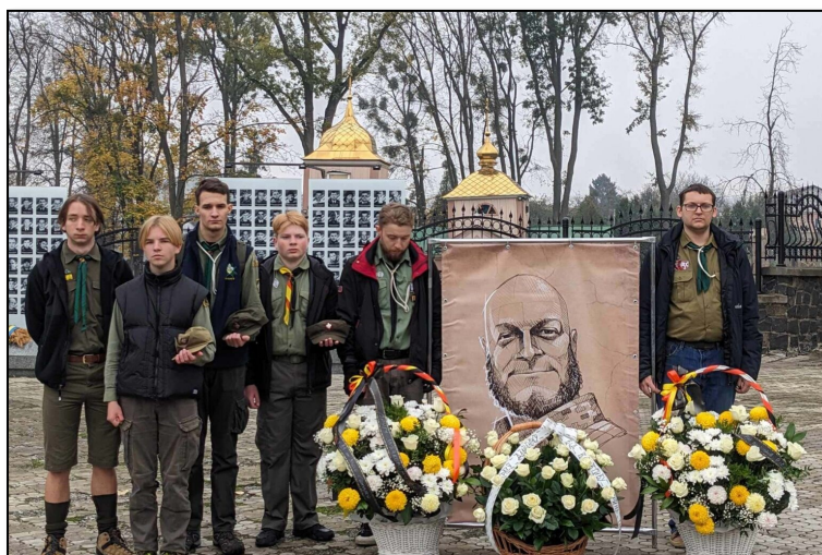
Біля могили на Грабнику...