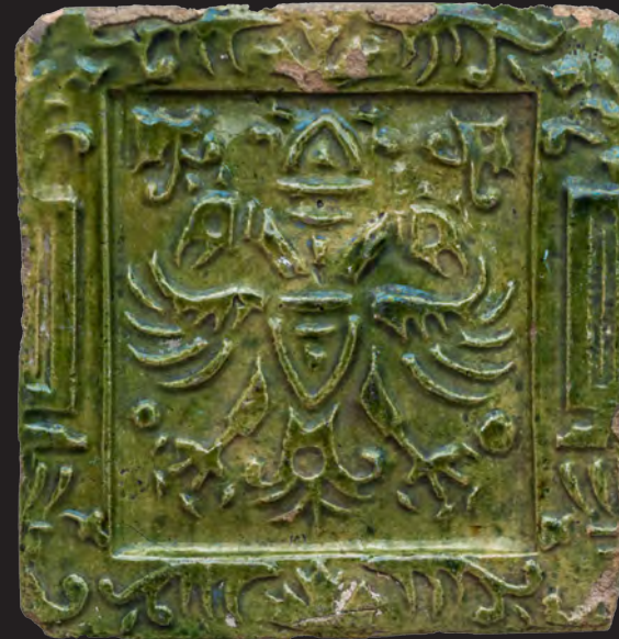
73. Кахля лицьова геральдична. XVII ст. ВКМ