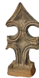
61. Увінчувальний елемент («коронка») XVI ст. РОКМ