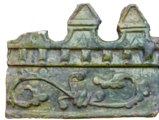
57. Увінчувальний елемент («коронка») XVI ст. ВКМ