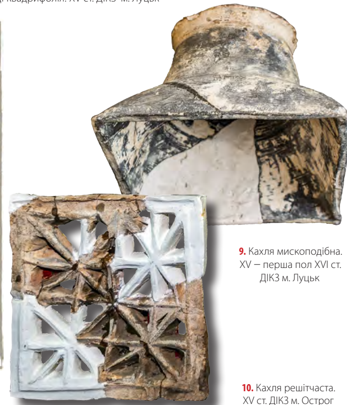
9. Кахля мископодібна. XV – перша пол XVI ст. ДІКЗ м. Луцьк