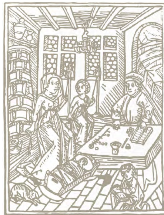
8. Зображення печі з мископодібних кахель. Бенедикт Бухпіндер. Гравюра. 1488 р.