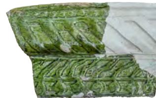
59. Кахля лицева карнизна. Кін. XVI – перша пол. XVII ст. ДІКЗ м. Острог