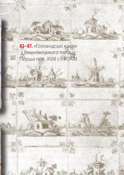
82-87. «Голландські кахлі» з Вишнівецького палацу. Перша пол. XVIII ст. РОКМ