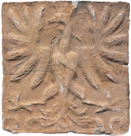
69. Кахля лицьова геральдична. XVI–XVII ст. ДІКЗ м. Острог