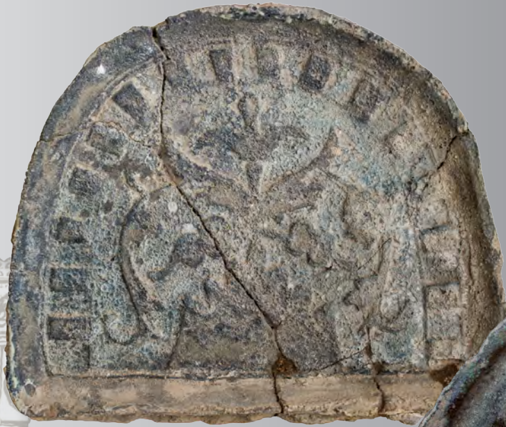
46. Кахля лицьова увінчувальна. Перша пол. XVII ст. ДІКЗ м. Луцьк