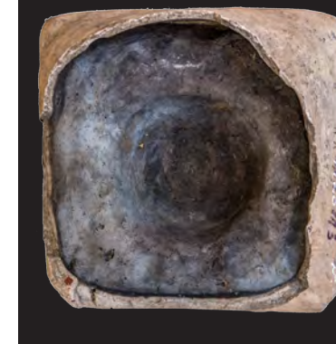
17. Кахля опукла.