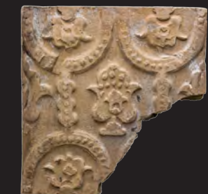
43. Кахля лицьова. XVI – XVII ст. ВКМ