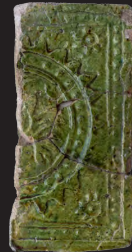
76. Кахля лицьова геральдична. XVII ст. ДІКЗ м. Луцьк