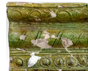
67. Кахля лицева карнизна. XVI – XVII ст. ДІКЗ м. Острог