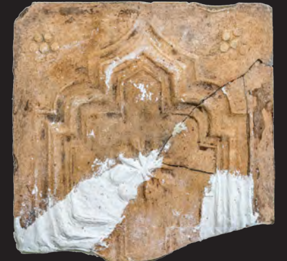
53. Кахля лицьова. XVII ст. ДІКЗ м. Острог