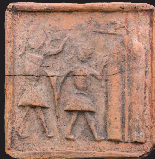
24. Кахля лицьова. XVI ст. ККМ