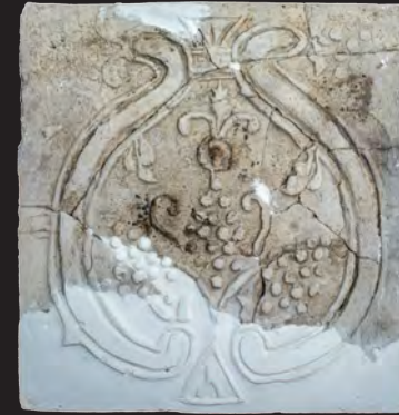
52. Кахля лицьова. XVII – XVIII ст. ДІКЗ м. Острог