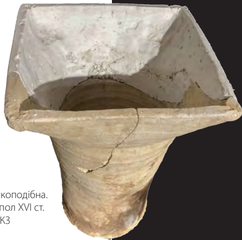
11. Кахля мископодібна. XV – перша пол XVI ст. КПДІКЗ