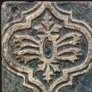
32. Кахля лицьова. XVII – XVIII ст. ДІКЗ м. Луцьк