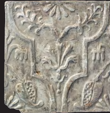
51. Кахля лицьова. XVI – XVII ст. ДІКЗ м. Дубно