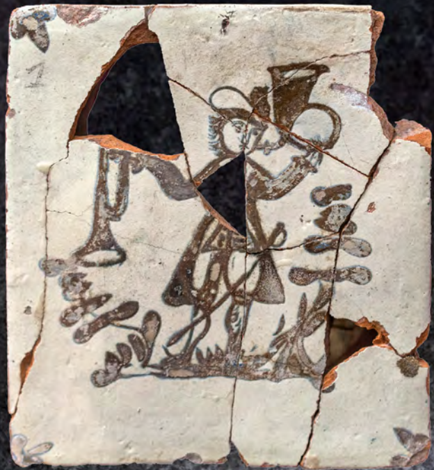
81. Кахля лицьова. XVIII ст. ДКЗ м. Дубно