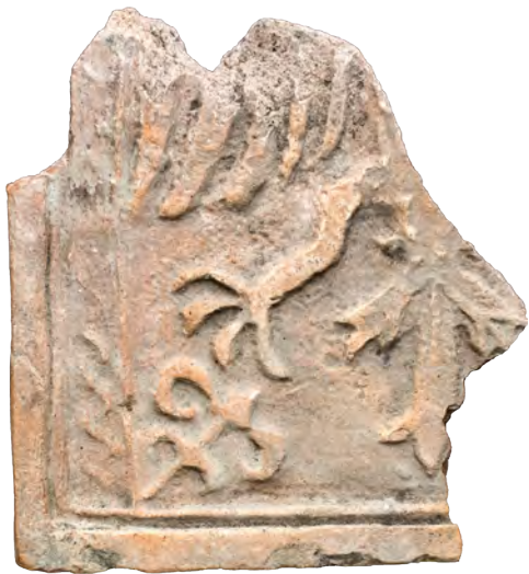
70. Кахля лицьова геральдична. XVI–XVII ст. ДІКЗ м. Луцьк