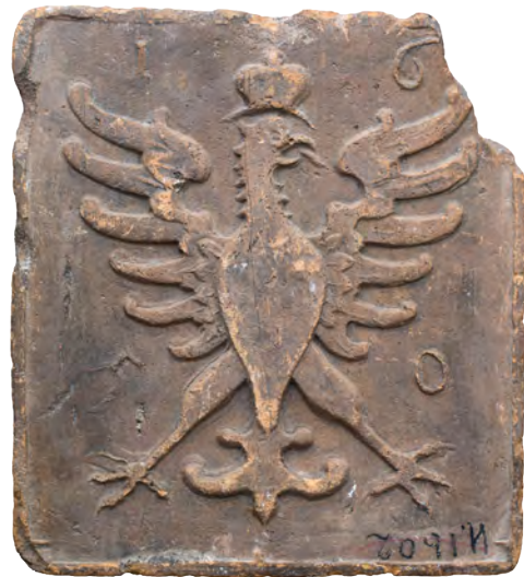
71. Кахля лицьова геральдична. 1650 р. ВКМ