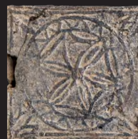
38. Кахля лицьова. XVI – XVII ст. ККМ