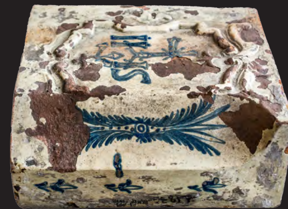
80. Кахля кутова з монограмою ордену єзуїтів. XVII – XVIII ст. ВКМ