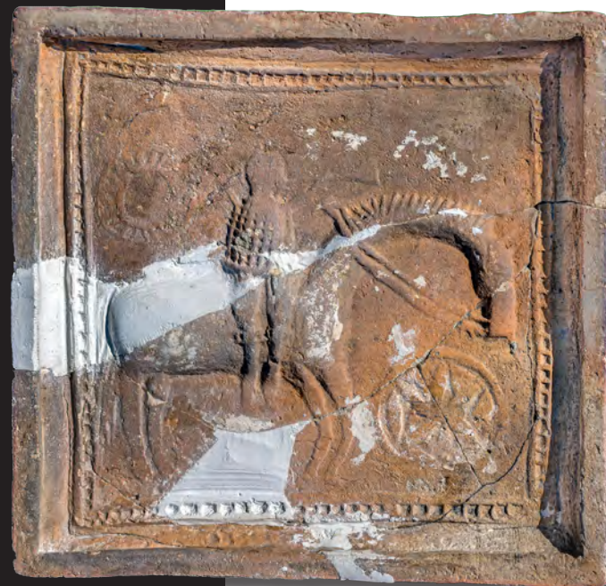
19. Кахля лицьова із зображенням вершника. XVI ст. ДіКЗ м. Луцьк