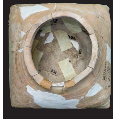
15. Кахля опукла.

Друга пол. XV – перша пол. XVI ст. ДІКЗ м. Дубно