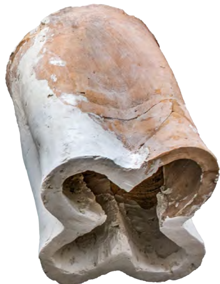
4. Кахля горщикоподібна з отвором у вигляді квадрифолія. XV ст. РОКМ