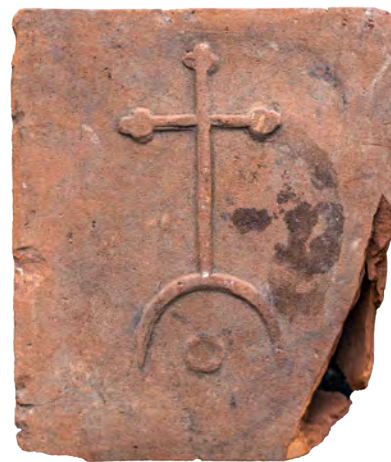
79. Кахля лицьова з Голгофським хрестом. XVII – XVIII ст. ДІКЗ м. Луцьк