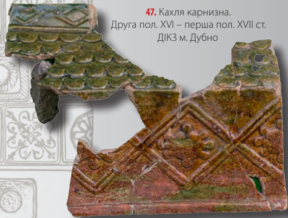
47. Кахля карнизна. Друга пол. XVI – перша пол. XVII ст. ДІКЗ м. Дубно