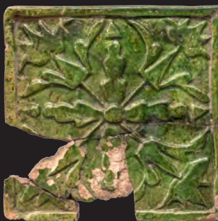
33. Кахля лицьова. XVI – XVII ст. ДІКЗ м. Дубно