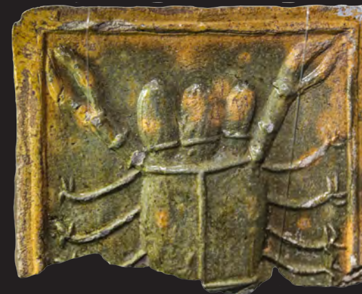
25. Кахля лицьова із зображенням знака зодіаку («Рак»). Перша пол. XVII ст. ДІКЗ м. Острог