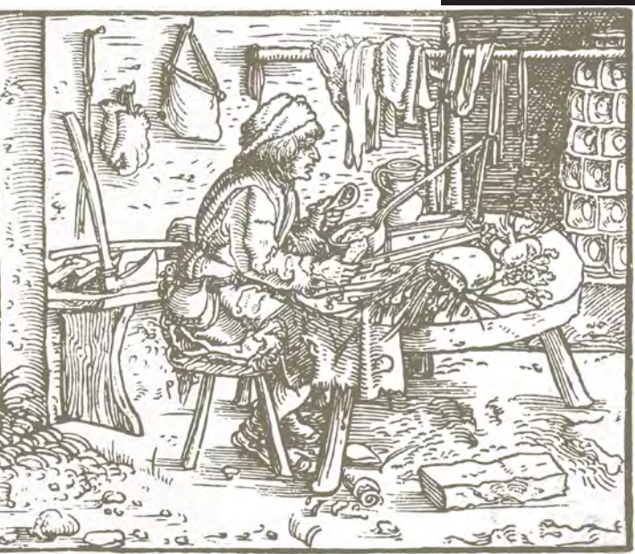
12. Піч з мископодібних кахель. Гравюра. Початок XVI ст.

Друга пол. XV – перша пол. XVI ст. ДІКЗ м. Острог