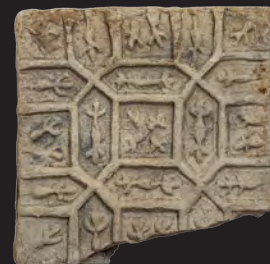
35. Кахля лицьова. XVI – XVII ст. ДІКЗ м. Острог