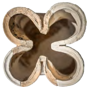
2. Кахля горщикоподібна з отвором у вигляді квадрифолія. XV ст. ДІКЗ м. Острог