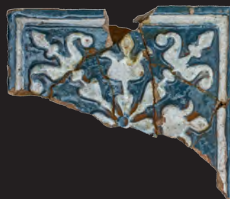
30. Кахля лицьова. XVI – XVII ст. ДІКЗ м. Острог