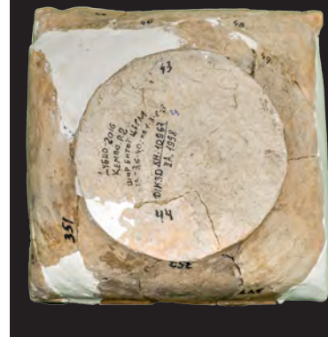
16. Кахля мископодібна.

Друга пол. XV – перша пол. XVI ст. ДІКЗ м. Дубно