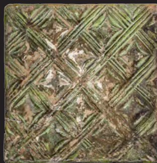
31. Кахля лицьова. XVI – XVII ст. ДІКЗ м. Острог