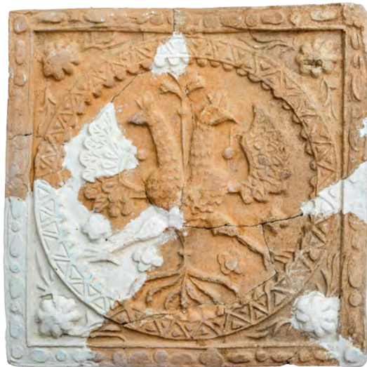
72. Кахля лицьова геральдична. XVII–XVIII ст. ДІКЗ м. Острог