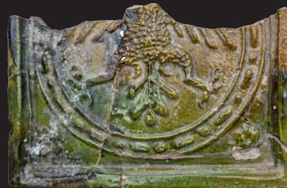
74. Кахля лицьова геральдична. XVII ст. ДІКЗ м. Луцьк