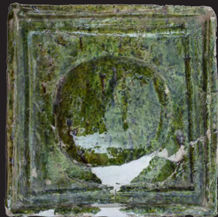
14. Кахля опукла.

Друга пол. XV – перша пол. XVI ст. ДІКЗ м. Острог