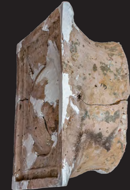
13. Кахля опукла.

Друга пол. XV – перша пол. XVI ст. ДІКЗ м. Острог