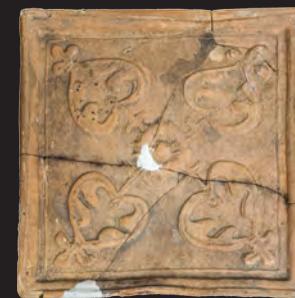
39. Кахля лицьова. XVI – XVII ст. ДІКЗ м. Острог