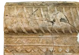
58. Кахля лицева карнизна. XVI ст. ДІКЗ м. Острог