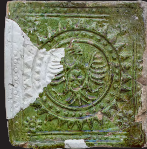
75. Кахля лицьова геральдична. XVII ст. ДІКЗ м. Луцьк