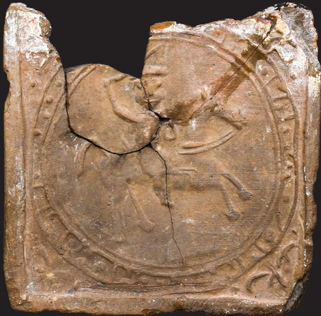
22. Кахля лицьова із зображенням вершника. XVI – перша пол. XVII ст. ВКМ