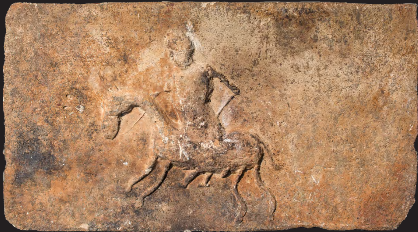
18. Кахля із зображенням вершника. XVI ст. ДіКЗ м. Острог