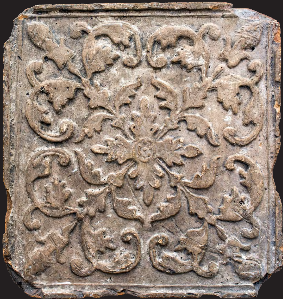
77. Кахля лицьова. XVI – XVII ст. ВКМ