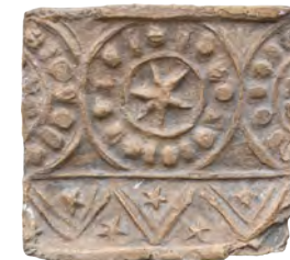
63. Кахля лицева карнизна. XVI–XVII ст. ВКМ