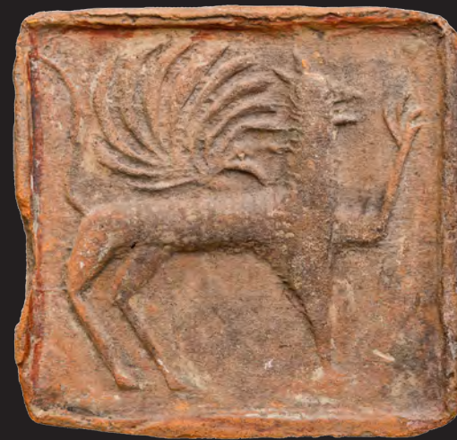
23. Кахля лицьова із зображенням грифона. XVI ст. ККМ