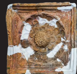
44. Кахля лицьова. XVI – поч. XVII ст. ДІКЗ м. Дубно