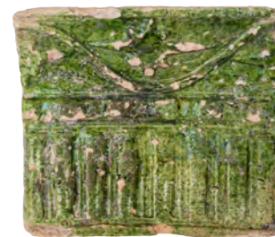
60. Кахля лицева карнизна. Перша пол. XVII ст. ВКМ