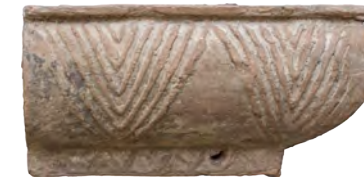
66. Кахля кутова карнизна. Кін. XVI – перша пол. XVII ст. ВКМ