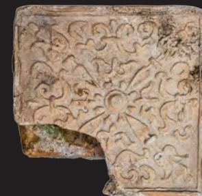
40. Кахля лицьова. XVI – XVII ст. ДІКЗ м. Острог