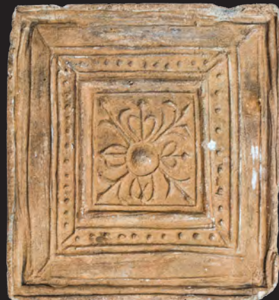
34. Кахля лицьова. XVI ст. ДІКЗ м. Острог