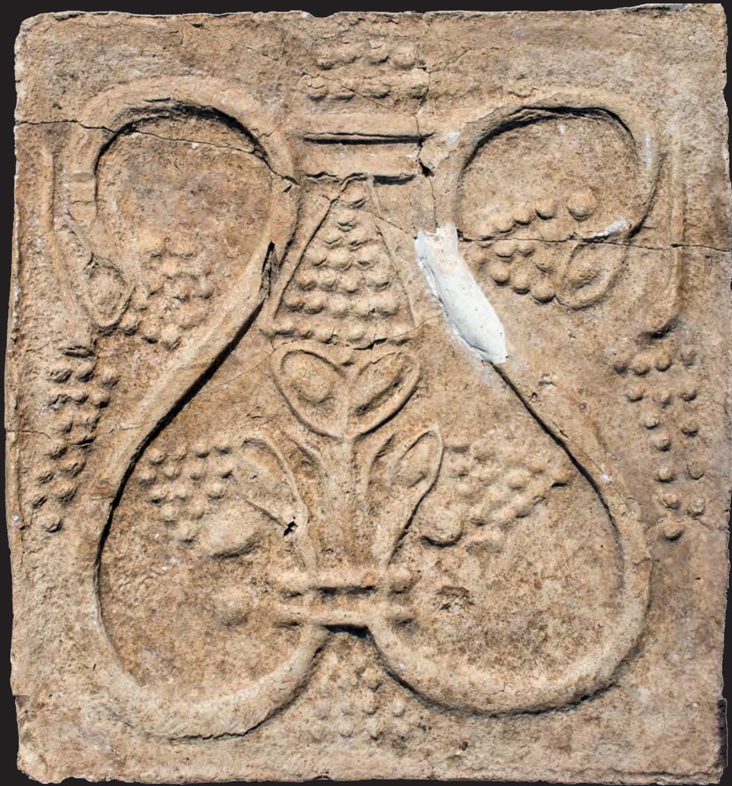
50. Кахля лицьова. XVII – поч. XVIII ст. ДІКЗ м. Острог