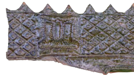
65. Увінчувальний елемент («коронка») XVI–XVII ст. ДІКЗ м. Дубно