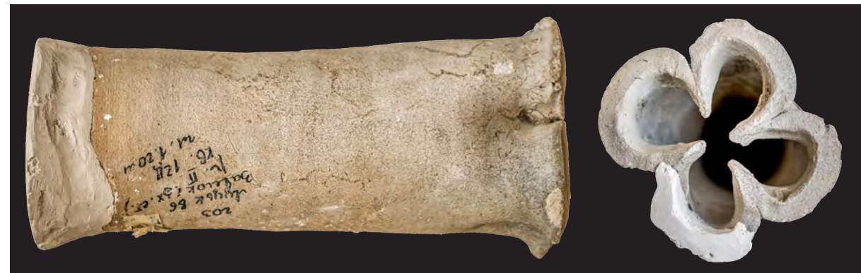
7. Кахля горщикоподібна з отвором у вигляді квадрифолія. XV ст. ДІКЗ м. Луцьк