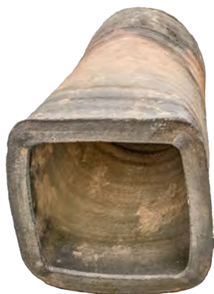
6. Кахля горщикоподібна з квадратним отвором. XV ст. РОКМ