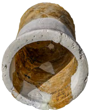
3. Кахля горщикоподібна з круглим отвором. XV ст. РОКМ