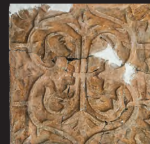
41. Кахля лицьова. XVII ст. ДІКЗ м. Острог