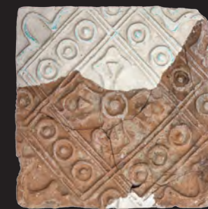
42. Кахля лицьова. XVI – XVII ст. ДІКЗ м. Острог