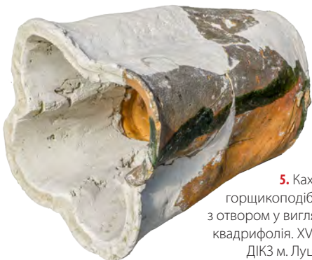
5. Кахля горщикоподібна з отвором у вигляді квадрифолія. XV ст. ДІКЗ м. Луцьк