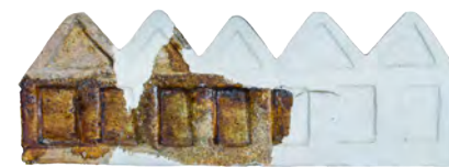
62. Увінчувальний елемент («коронка») Кін. XVI – перша пол. XVII ст. ДІКЗ м. Острог