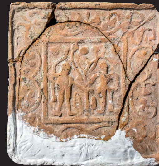
26. Кахля лицьова із зображенням райського дерева та Адама і Єви. XVI ст. РОКМ