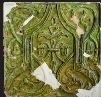
29. Кахля лицьова. XVII – XVIII ст. ДІКЗ м. Острог