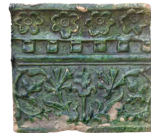
64. Кахля лицева карнизна. Кін. XVI – перша пол. XVII ст. ВКМ