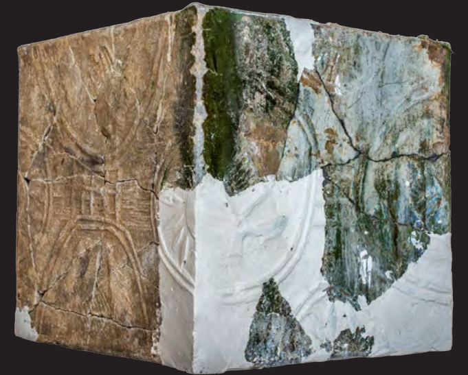
55. Кахля кутова. XVI – XVII ст. ДІКЗ м. Острог