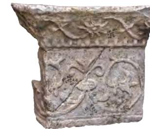
68. Кахля кутова карнизна. XVI ДІКЗ м. Дубно