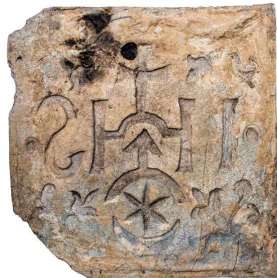
78. Кахля лицьова з монограмою ордену єзуїтів і гербом князів Острозьких. Перша пол. XVII ст. РОКМ