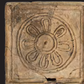
37. Кахля лицьова. XVI ст. ДІКЗ м. Острог