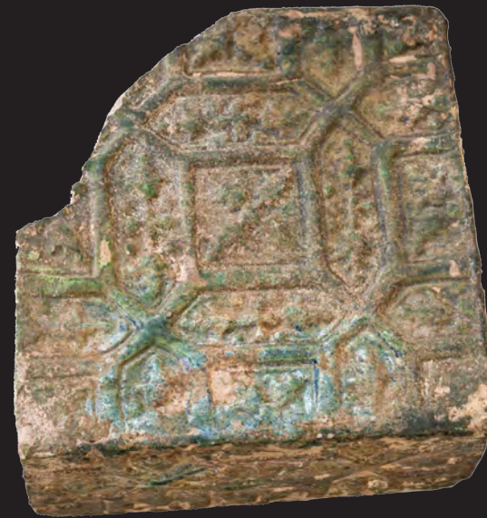
54. Кахля кутова. XVI – XVII ст. ККМ