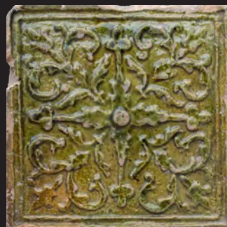
28. Кахля лицьова. XVI – XVII ст. ВКМ