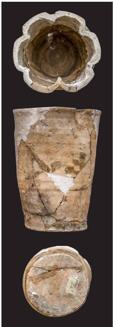
1. Кахля горщикоподібна з отвором у вигляді квадрифолія. XV ст. ДІКЗ м. Луцьк