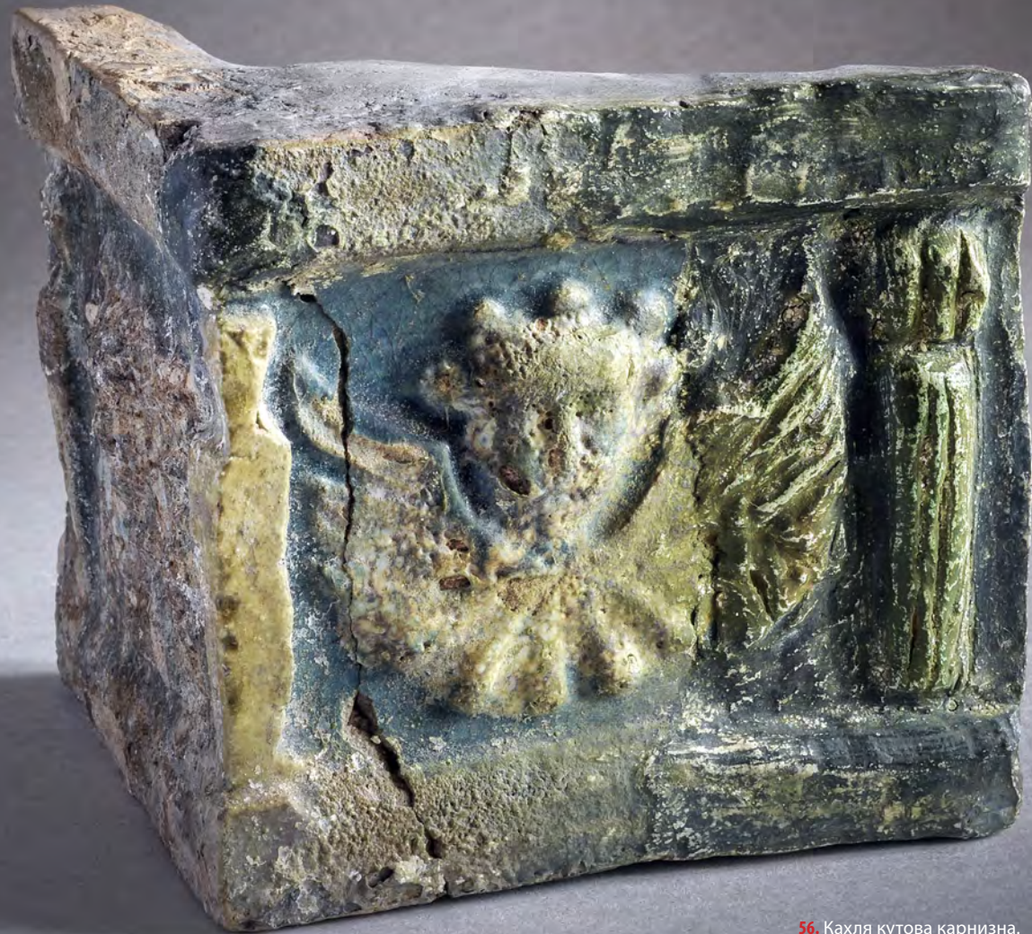
56. Кахля кутова карнизна. XVII ст. ДІКЗ м. Луцьк