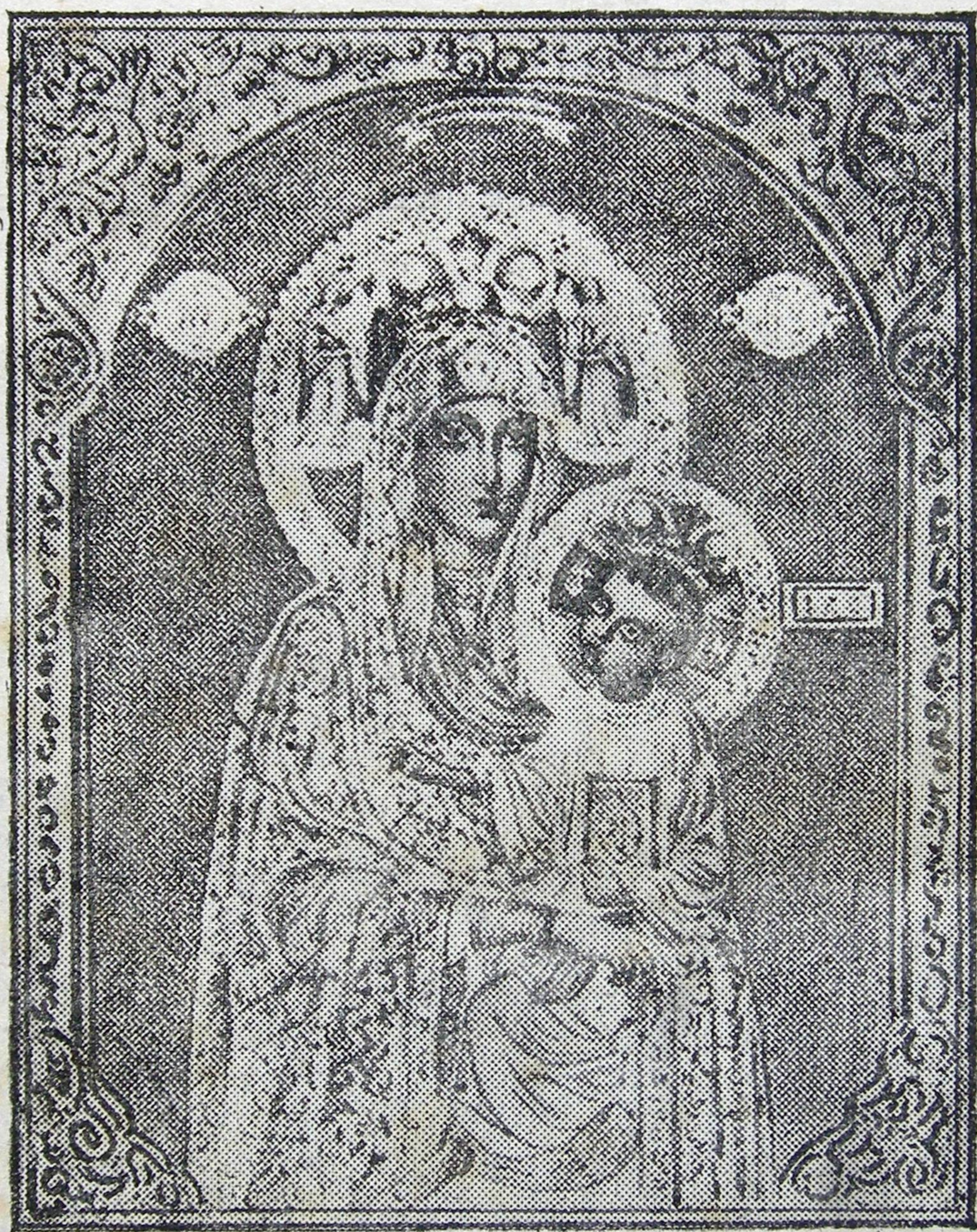
Изображеніе Божіей Матери Загаецкія, Сла҃ящіяся милостями.