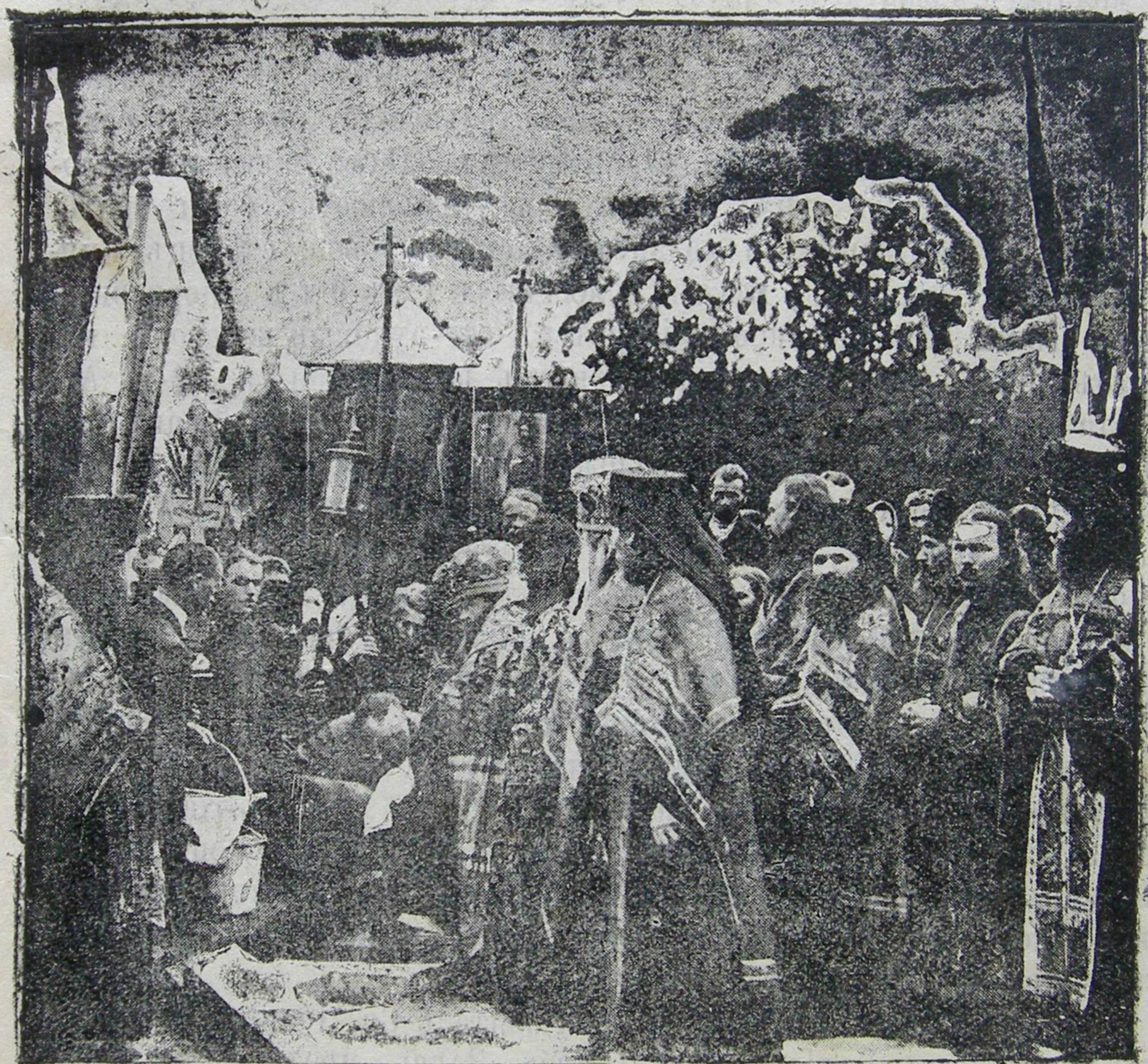
Закладаа скита обители.

обѣдать. Пища для всѣхъ одна, отдѣльно готовить себѣ пищу строго воспрещается. Пища бываетъ для всѣхъ постная, монахи Загаецкаго монастыря мяса никогда не вкушаютъ, даже на Пасху и то имъ не разрѣшается мясная трапеза, а только сыръ, масло и яйца; во всѣ же посты пищу ѣдятъ даже безъ елей. Во время трапезы очередной монахъ читаетъ душеполез