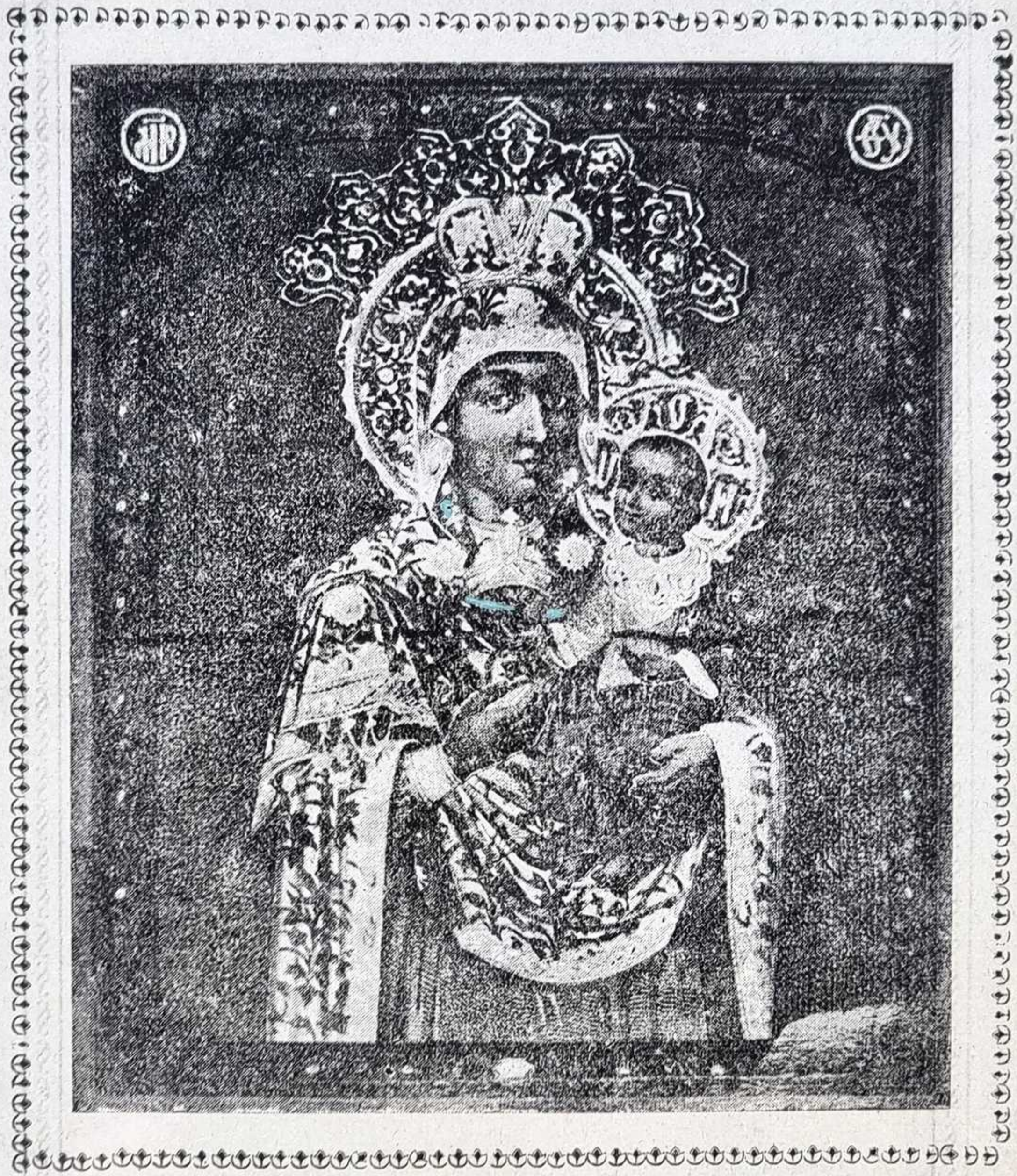
Изображение Загоровской Чудотворной иконы Божіей Матери.