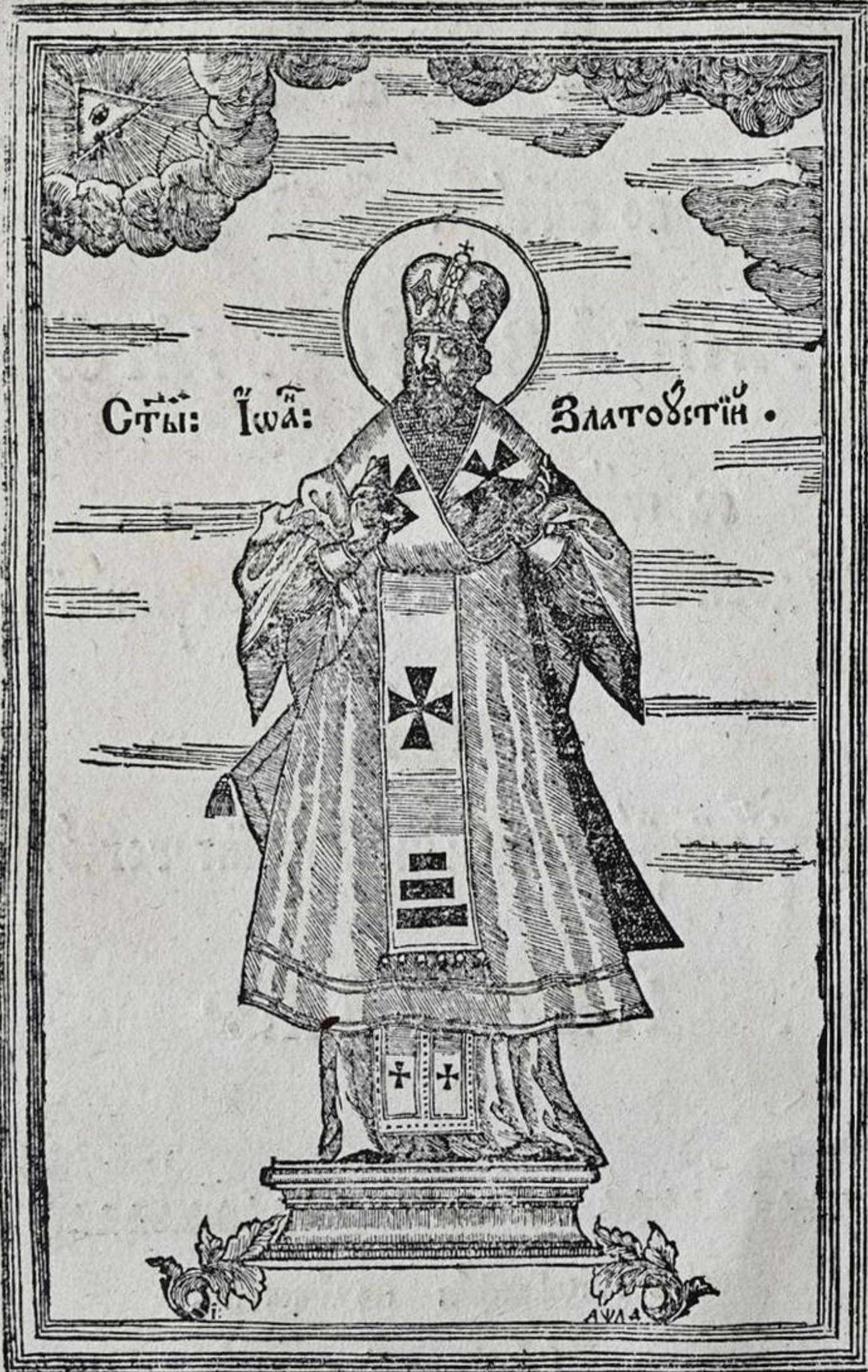
Сѣи: Іѡа: Златоустѣи .