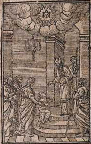
Тропарь Галса, а.

Днесь благоволеніа Бжїа пред- сраженіа, и члкъше спїсїа про- повѣданїа, въ Чркви Бжїи мнш дѣа мѣласта, и хрїта всѣмъ какобствѣхъ. Тои и мѣ вѣа- галсш козопїмъ: раддїса смо- трїа зндїтїа исполнїи.