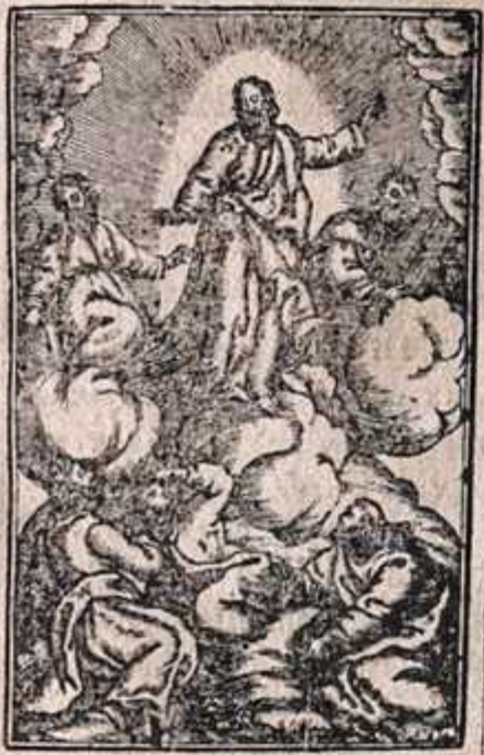
Тропарь Гора, Г.

Надѣншица на гора, мѣхъ гора Свѣтъ, ии подвигнута въ гора.