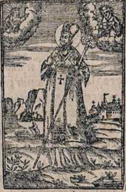
Тропарь Гласъ, ѿ.

Пренесенїе чѣтнѣхъ мощей СѢАГѡ НІКОЛАѢА ЧѢДОБОРЦА ѡ МІРѢ ЛУКІИНСКНХЪ, ВО ГРАДЪ БАРЪ.