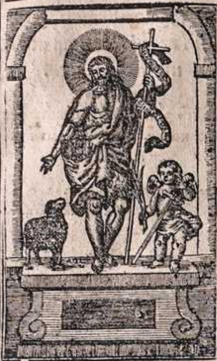
Троїаръ, Галсъ, х.

Прѣче и Прѣче прѣшествѣа Хѣа, доутоишъ коухеланти тѣа не до- умѣемъ ма, амебѣно чѣдѣшн тѣа; неплодство ко рождшѣа, и шѣче кѣзглѣсѣе раздѣшнѣа, славѣномъ и чѣтнѣомъ рѣжѣкомъ теомъ; и коплощнѣе Оѣа Бжѣа мѣроѣи проповѣдѣствѣа.