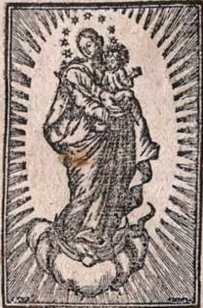
Трѣаръ, Гласъ, и.

Члѣшѣ сѣннѣа прѣимѣ, и пѣмѣ гдѣнѣ прѣзобѣ, Далавѣа.